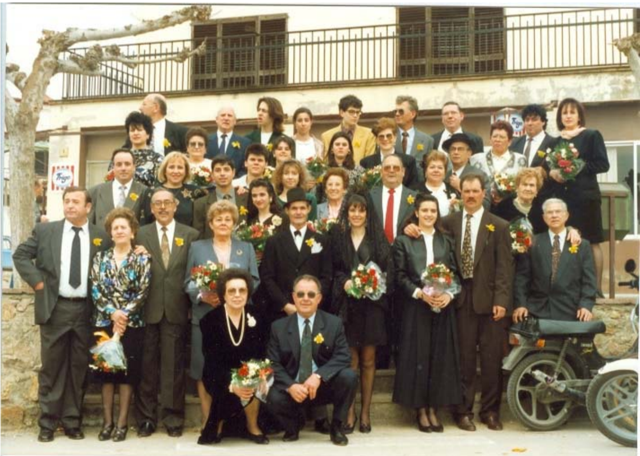
Aquesta foto és aproximadament al voltant dels anys 1994 o 1995 era el ball de 10 de Carnaval i fixeu-vos en aquella època el llaç groc que es portava!