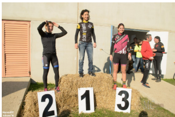
L'ambient a la zona del podi