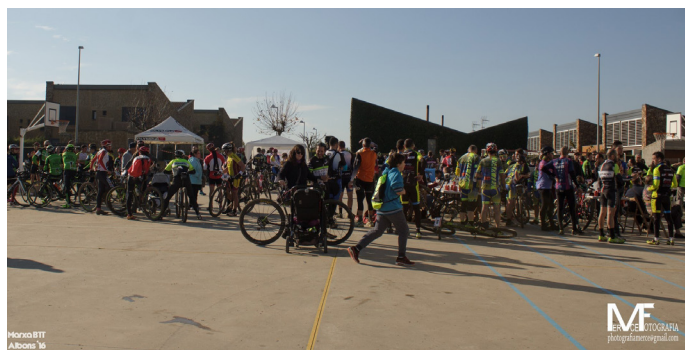
Podi femení dels 35 km - Foto de Miquel Calvet