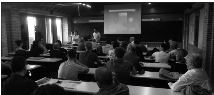
El taller de discussió titulat «Actualitat de Pierre Vilar i de Josep Fontana, actualitat del marxisme».