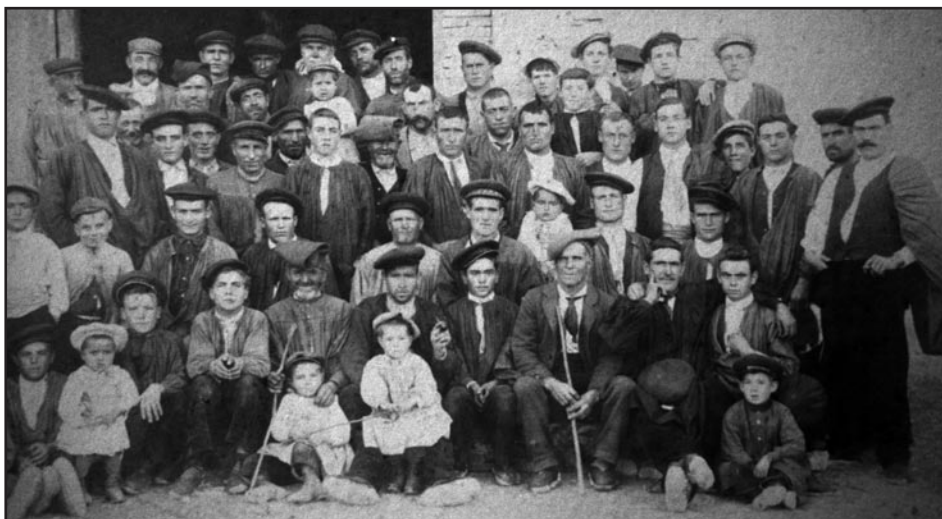
Grup de socis fundadors de la Societat Agrícola de Barberà, inicis del segle XX.