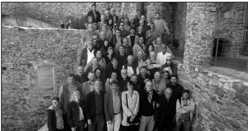
Grup d'assistents a les XX Trobades Culturals Pirinenques.