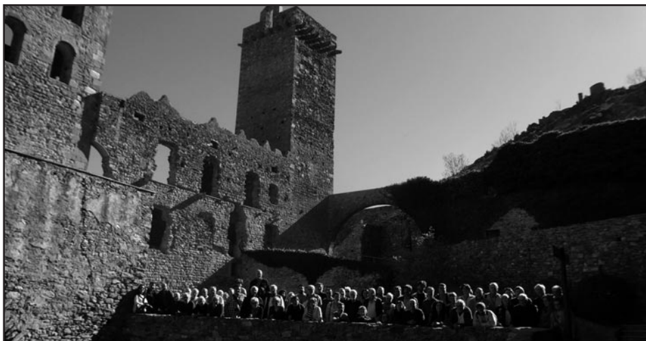
Al pati del monestir de Sant Pere de Rodes, amb el campanar i la torre de defensa al fons.