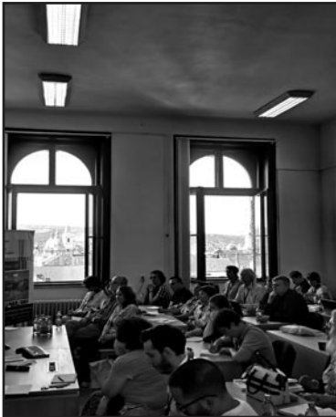
Amb la sala plena, a la ciutat romanesa de Cluj-Napoca.