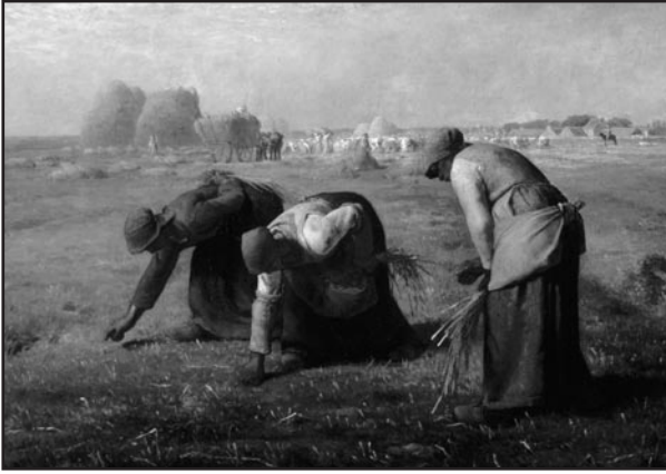
Les espigoleres de Jean-François Millet.

En el següent apartat tractarem de mostrar alguns exemples de com aquelles cançons poden informar i interrogar-nos sobre les pràctiques socials en la contractació, la percepció de l'esforç físic i els guanys econòmics que implicaven determinades tasques i modalitats contractuals. Ens referirem únicament a dues d'elles, segar i espigolar, i explorarem les relacions que hi podia haver entre tècnica, modalitat contractual i distribució dels ingressos. En particular, suggerirem que la generalització de l'escarada com a modalitat majoritària en la contractació del segar i l'espigueig a mitges pogueren formar part d'un mateix paquet contractual. Les tonades sobre el segar i l'espigueig suggereixen preguntes i també permeten intuir la resposta, però exigeixen una contrastació amb altres fonts, ja siguin de comptabilitat, processos judicials, estadístiques i interrogatoris, o altres testimonis orals o escrits de l'època.