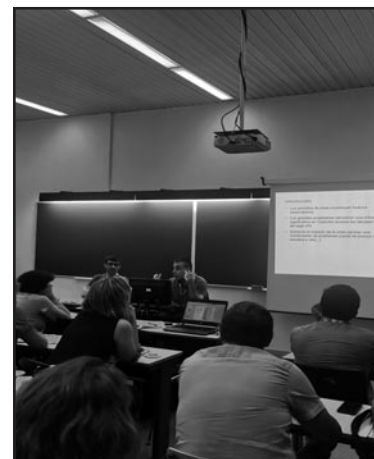
Una sessió de la trobada de la SEHA a Coïmbra.