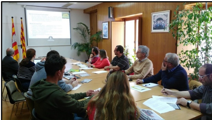
Reunió de la Comissió de Seguiment. 11/04/2018