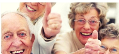
RETORN PROCÉS PARTICIPATIU GENT GRAN 28 DE SETEMBRE DE 2018 Ajuntament de Palafrugell

El 28 de setembre de 2018 va tenir lloc en l'auditori del Museu del Suro el retorn del procés participatiu. Es va convocar a tota la població més gran de 65 anys per correu postal.